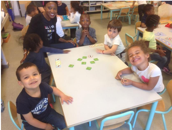
Atelier jeux mathématiques avec les parents, en petite section