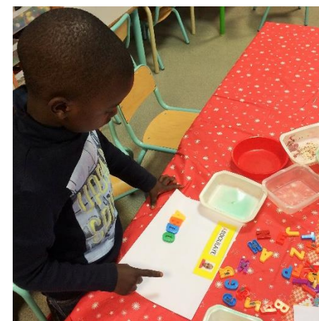
Travail autour des lettres