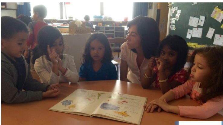
Apprendre à « parler » un livre - moyenne section