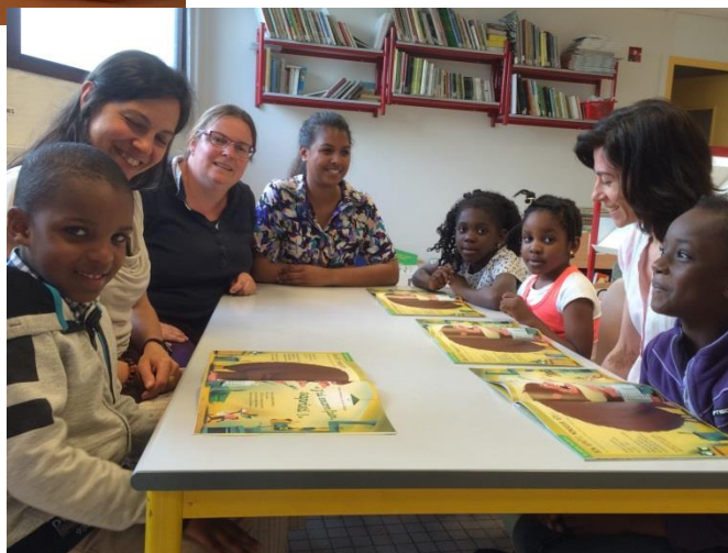
Le club Langage