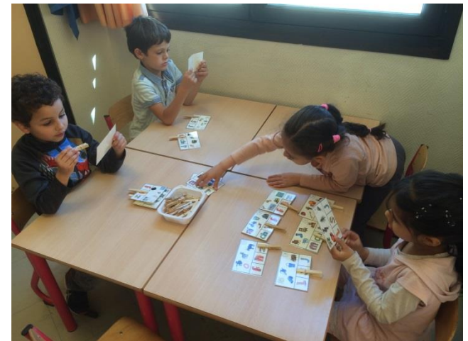
Atelier discrimination auditive en GS avec le matériel Alpha