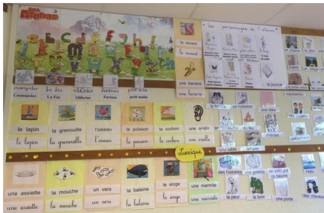
Affichage classe CP : apprentissage du code à partir des alphas